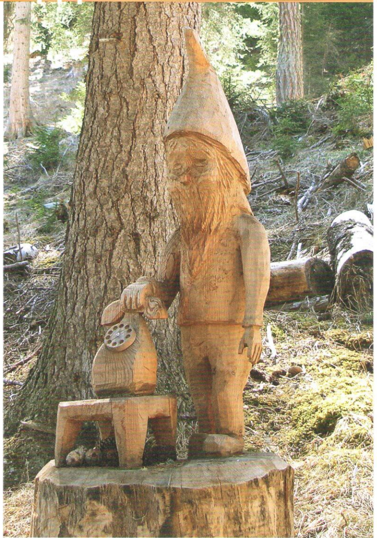
Ein erlebnisorientierter Lehrpfad für Familien mit Kindern und für Schulklassen. Er bietet seinen Besucherinnen und Besuchern viel Spannendes rund um die Themen Holz und Wald.

florinetttag@florinett-holz.ch , www.florinett-holz.ch