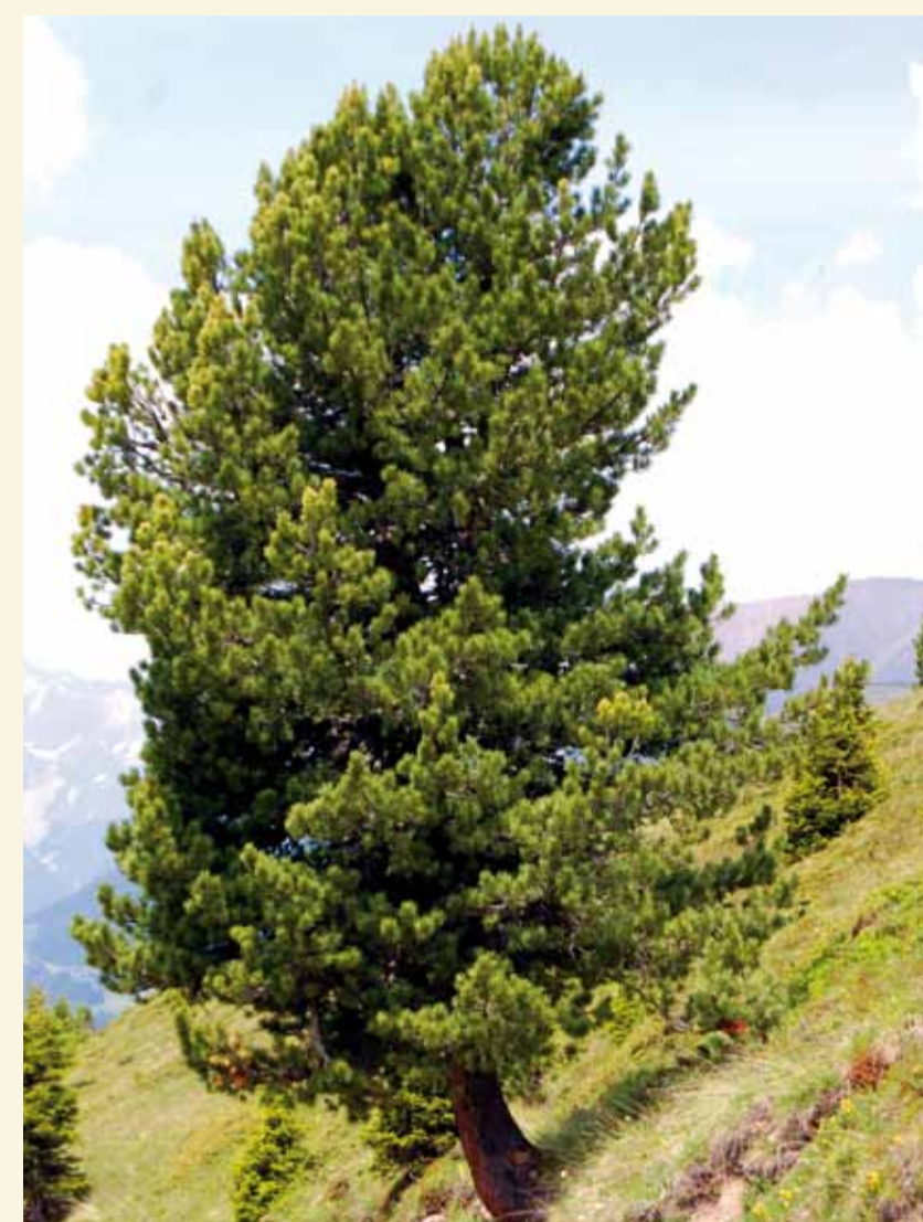
Der lebenszähe Hochgebirgsbaum.